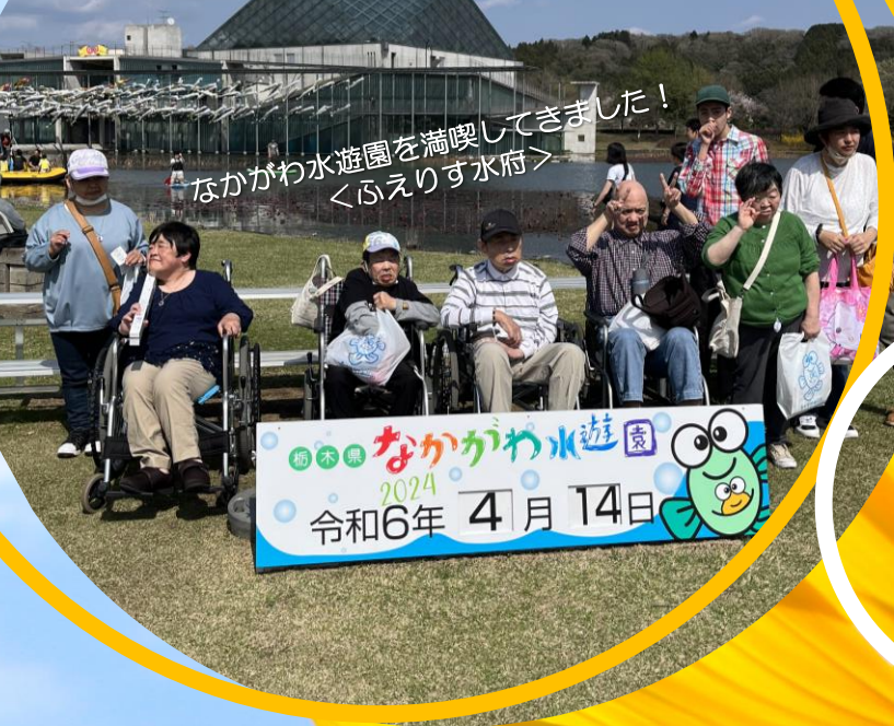
なかがわ水遊園を満喫してきました！ 〈ふえりす水府〉