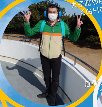
犬子町や日立市散策♪ ＜GHひらそる＞