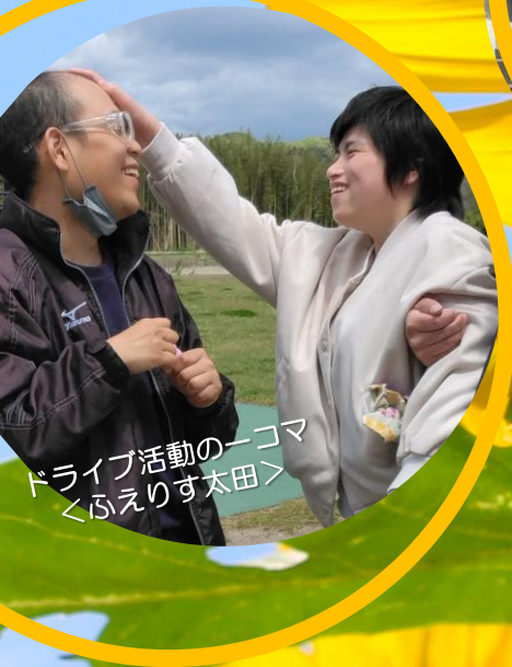
ドライブ活動の一コマ 〈ふえりす太田〉