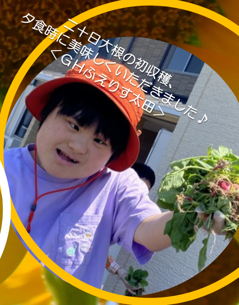
二十日大根の初収穫、 夕食時に美味しくいただきました♪ 〈GHふえりす太田〉