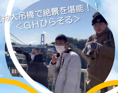
竜神大吊橋で絶景を堪能！ ＜GHひらそる＞